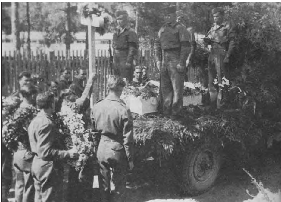
En av russerne i Hommeleiren i Øvrebø forulykket og ble gravlagt ved Øvrebø kirke. Her under under begravelsen.