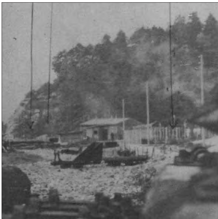
Etterretningsbilde fra XU-agent Henry Aamo i 1943. Bildet viser russerleiren på Nodeland i Greipstad.

Totalt ble det bygd opp 20-25 større eller mindre leirer i Agderfylkene mot nærmere 400 på landsbasis. For de 2000-3000 russiske krigsfangene på Agder var arbeidsoppgavene mange: Skogsarbeid med vedhogst, trefelling og fløting, grøftegraving og nydyrking. Andre deltok i byggeprosjekter på veier, jernbanen, tunneler, flyplasser, snømåking og lossing. Alt for å bygge ut «Festung Norwegen».