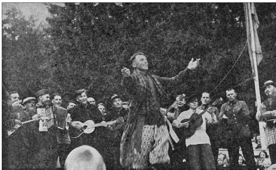
Russerne brukte mye av fritiden i leiren til å lage instrumenter. I fredsdagene underholdt de nordmenn med sang, musikk og dans. Her fra en konsert i Ravnedalen sommern 1945.