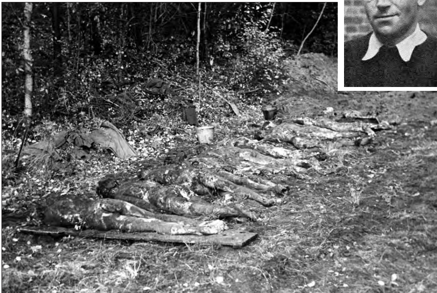
De tyske gestapistene måtte selv grave opp likene av de russiske krigsfangene de hadde skutt. Her fra Bragdøya i 1945. «Russermorderen» Glomb innfelt.