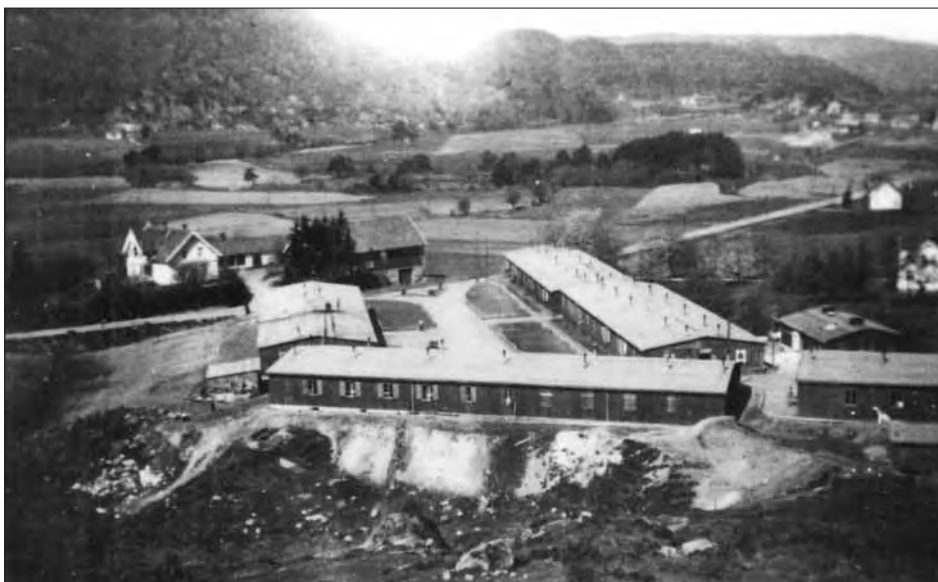
Fra leiren på Rosseland i Greipstad.