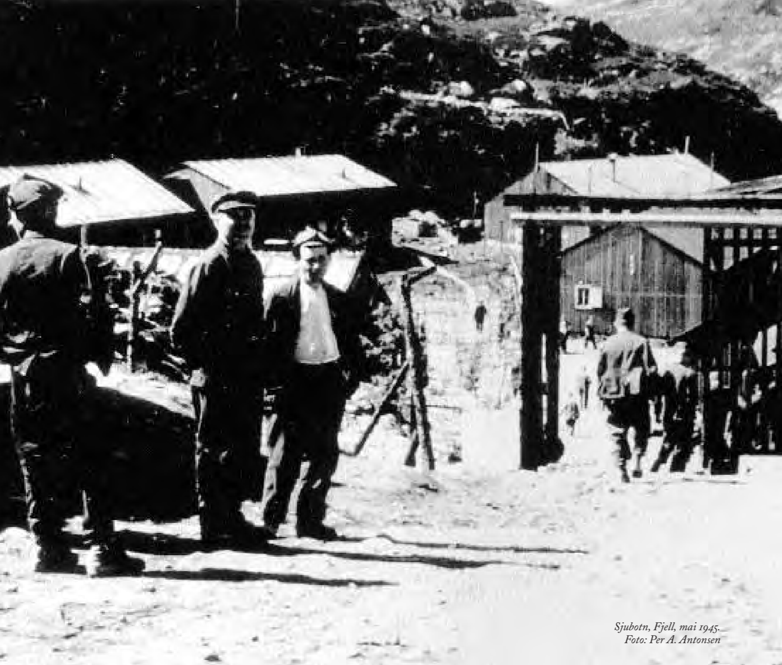
Sjubotn, Fjell, mai 1945.