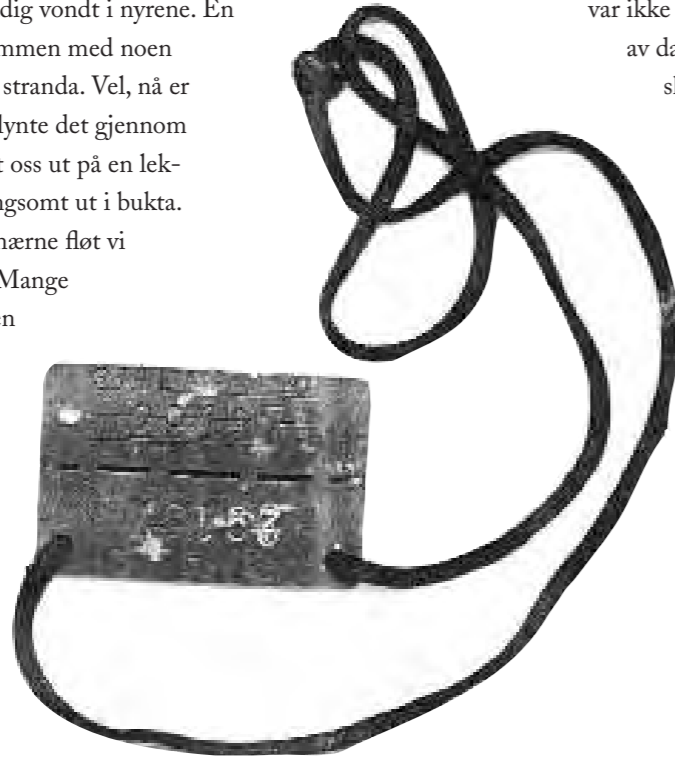
Komovs ID-merke. Merket kunne knekkes om fangen døde, hvorpå den ene delen ble sendt til Berlin for registrering. STALAG betyr «Stamm-lager», der fangen fikk sin identitetsbrikke og nummer. Videre er ID-merket stemplet 2H, som står for Stettin (Szczecin) i det nåværende Polen.

Fra da av har jeg stadig vondt i nyrene. En dag tok han meg sammen med noen andre fanger ned til stranda. Vel, nå er siste time kommet, lynte det gjennom hodet mitt. De jaget oss ut på en lekter som ble tauet langsomt ut i bukta. Stående i vann til knærne fløt vi avgårde i tre dager. Mange ville omkommet uten hjelp fra nordmennene. Når de fascistiske vaktene gikk for å hvile i kahytta, kom nordmenn ubemerket bort på slepebåten for å gi oss litt å spise og ombord på lekteren kom det flytende en del store tørrfisker.